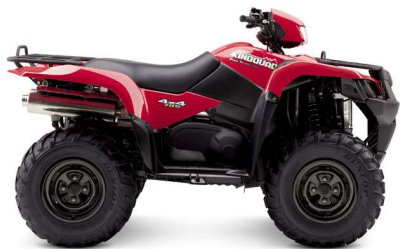
YT9: Rojo Fuego