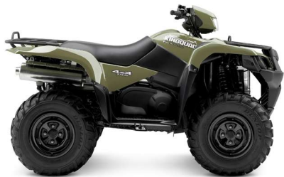
YLG: Verde Tierra

Motor monocilíndrico de 695 cc con doble árbol de levas en cabeza, 4 válvulas y refrigeración líquida. Inyección digital de combustible. Encendido electrónico CDI. Arranque eléctrico y manual. Transmisión variable continua CVT con embrague centrífugo. Selector de marchas corta, larga, punto muerto y marcha atrás. Botón de selección para 2 o 4 ruedas motrices y palanca de bloqueo del diferencial delantero totalmente electrónicos. Suspensiones delantera y trasera totalmente independientes con doble trapecio y amortiguadores hidráulicos con regulación de precarga de muelle. Doble freno de disco delantero y trasero multidisco estanco en baño de aceite. Freno de estacionamiento. Completo tablero de instrumentos mediante pantalla de cristal líquido con información sobre la marcha engranada y el modo de tracción. Doble óptica delantera multirreflector. Óptica direccional en el manillar de 40 W. Toma de corriente de 12 V. Parrilla delantera y trasera y soporte para enganche de remolque de serie. Preinstalación para winch. Compartimento para objetos estanco. Depósito de 17,5 L.