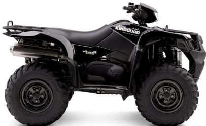
019: Negro Sólido