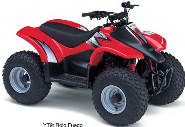
YT9: Rojo Fuego