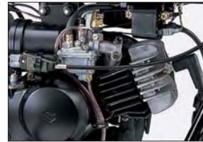
Motor dos tiempos y 49 cc