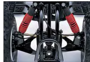
Doble amortiguador delantero